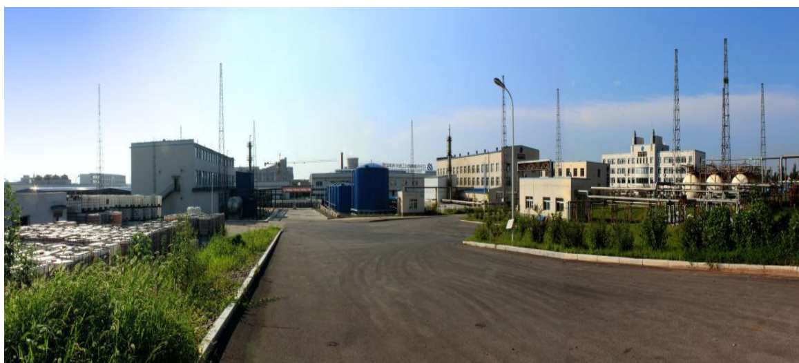
图 1 辽宁科隆精细化工股份有限公司全景图

2014 年 10 月 30 日，在深圳证券交易所挂牌交易成为上市公司。股票简称：科隆精化，股票代码：300405，开启了进入资本市场的崭新一页。